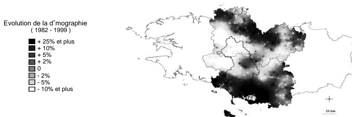
Figure 2. La formalisation d'évolutions passées à long terme et à grande échelle permet l'extrapolation de tendances futures : l'exemple de la démographie.

Le mode de construction du scénario tendanciel est donc essentiellement l'extrapolation des mécanismes de régulation du territoire en place actuellement. Par exemple, on maintient l'hypothèse que l'usage des sols sera en grande partie déterminé par l'évolution de l'agriculture sur des critères de performance économique et que les actions réglementaires s'inscrivent dans ce cadre. Dans cette optique, les perspectives macro-économiques des grandes filières (lait, volailles, porcs, cultures) sont comparées et des hypothèses à long terme sont proposées (recul des volailles, concentration des exploitations laitières et porcines...). De même, les tendances démographiques et socioprofessionnelles sont prolongées en conservant les mêmes critères d'attractivité du territoire. Des cartes d'évolutions régionales resituant le Blavet dans un cadre plus large sont alors particulièrement mobilisées. La figure 2 illustre cette approche pour la démographie.