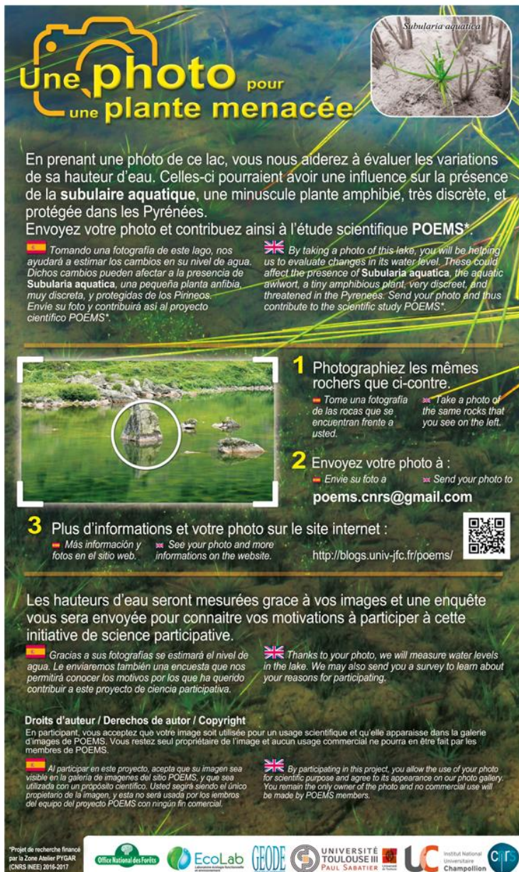
Un panneau du dispositif